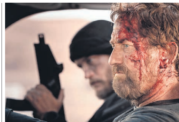
Унести ноги из Афганистана у агента Тома Харриса (Джерард Батлер) получается с переменным успехом

В погоне за Томом участвуют все фигуранты афганского конфликта, используя при этом вертолеты, тяжелые