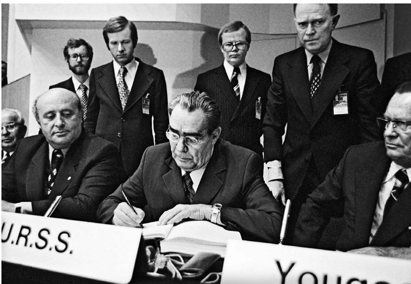
ОБСЕ — организация, которая была создана на основе заключительного акта Совещания по безопасности и сотрудничеству в Европе, подписанного Леонидом Ильичом Брежневым, может скоро прекратить свое существование

Эстония выдвинула свою кандидатуру на председательство в ОБСЕ в конце 2021 года, то есть еще до резкого обострения конфликта между Россией и западными странами — членами организации вокруг Украины. Но уже тогда, на декабрьском заседании глав МИДов стран-участниц ОБСЕ в Стокгольме, Россия выступила против эстонской заявки (дав добро на кандидатуры Северной Македонии и Финляндии). Отношения между Москвой и Таллином деградировали все последние годы, так что это было отчасти ожидаемо, хоть тогда многие еще надеялись, что компромисс будет найден. Но после ввода российских войск на Украину шансов договориться не осталось: парламент Эстонии объявил Россию государством-спонсором терроризма, а правительство потребовало вдвое сократить численность персонала российского посольства в Таллине; в ответ власти РФ выслали из страны эстонского посла и объявили о понижении уровня дипломатических отношений с Эстонией.